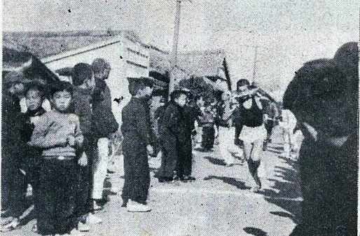
写真は子供会の町内對抗駅伝大会

長洲地区(十八チー) 一位 大明神子供会 24分01秒 二位 新山子供会 24分58秒 三位 西荒神子供会 25分16秒 四位 新町子供会 25分24秒 五位 中町子供会 25分27秒 六位 東荒神子供会 25分45秒