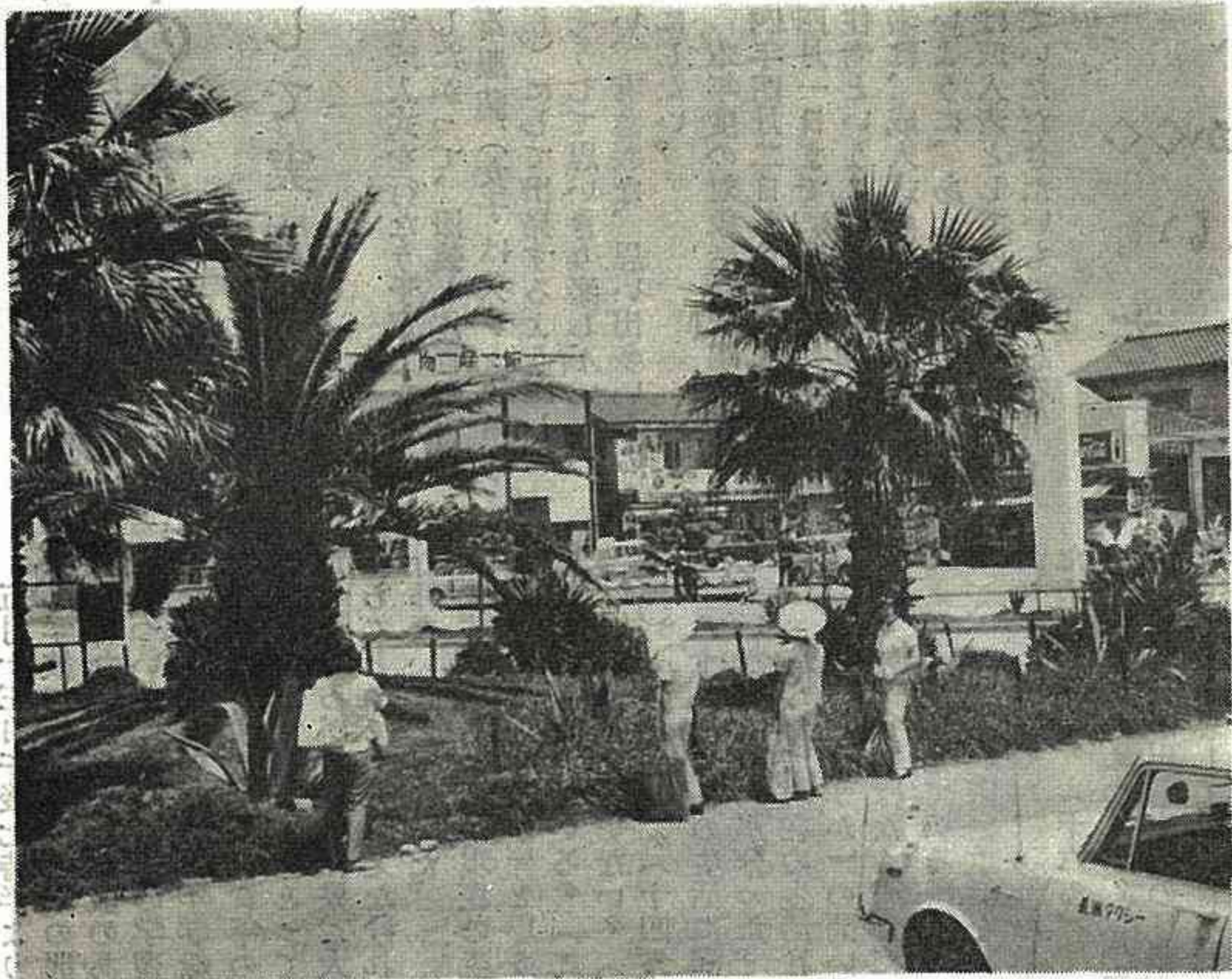
(初夏の航送船広場)