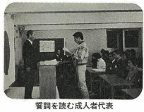
誓詞を讀む成人式代表

ご神火に誓う 二十才の若者たち 新年の気候は、新たな一月五、六日、元旦の雪が、雪の阿蘇青年の家に成人式が行われる。