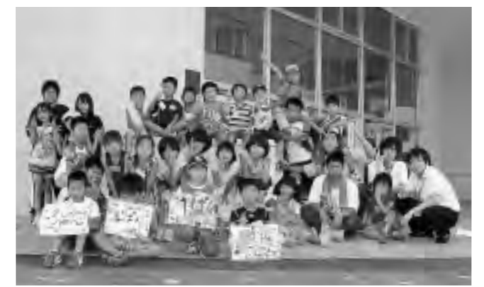
1期の参加者のみなさん