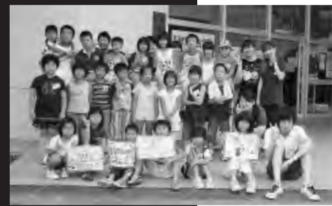
2期の参加者のみなさん