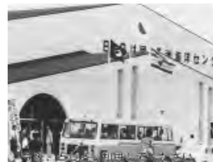
▲長洲海洋センターは、昭和52年8月7日オープン。開所式には約200人が出席しました。

期待される効果 1、サービスの向上 民間事業者の持つ知識や経験を活用することで、利用者の要望に対応した 2、新しい発想の活用 民間事業者の新たな発想(事業計画)による事業展開が行われ、施設の利用促進が期待できます。 3、施設運営の効率化とコストの削減 民間事業者が持つ、多様な人材確保などの優れた経営能力により、施設運営の効率化やコストの削減が期待できます。 4、指定管理者制度の導入 長洲町のスポーツ振興は、▼生涯スポーツの推進▼競技スポーツの推進▼社会施設整備の3本の柱を設けて推進しています。長洲町総合スポーツセンター施設の管理運営は、これまで町が直営で進めてきました。しかし、平成15年6月に地方自治法が改正され、これからは民間事業者なども、公共施設の管理を行うことができるようになりました。これが「指定管理者制度」というものです。 5、町の施設としては初めて、10月1日より総合スポーツセンターに指定管理者制度を導入し、民間事業者の活力を生かして、運営を行うことになりました。