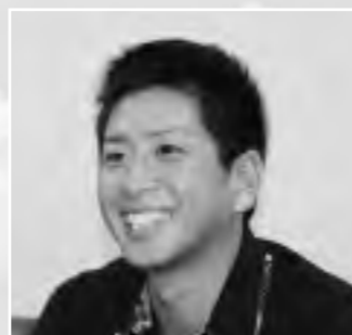
インストラクター

長洲町総合スポーツセンターを利用して、子どもから高齢の皆さんまで、たくさんの人にスポーツの楽しさを知ってほしいと思います。そのためにも、皆さんの声を聞きながら、喜んでいただける企画内容を考えてまいります。また、室内温水プールは、あまり他ではない立派な施設なので、一人でも多くの人に利用していただき、その良さを再認識していただけたらと思います。低料金なので、たくさんの施設を利用して楽しんでほしいです。