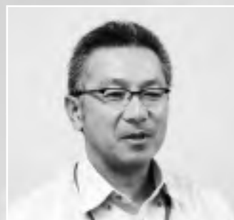
指定管理者準備室室長