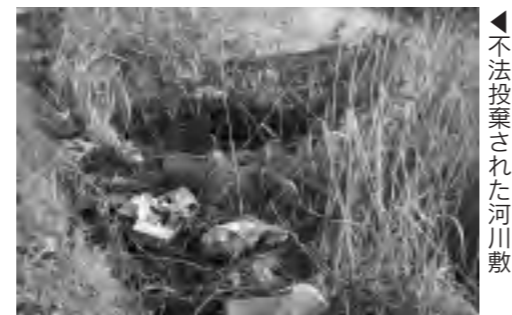
不法投棄された河川敷

ごみのポイ捨て(不法投棄を含む)は犯罪です。悪質な不法投棄でごみを捨てた人が特定された場合は、警察への通報を行います。美しい長洲町に住むために、一人ひとりがごみについて考えましょう。