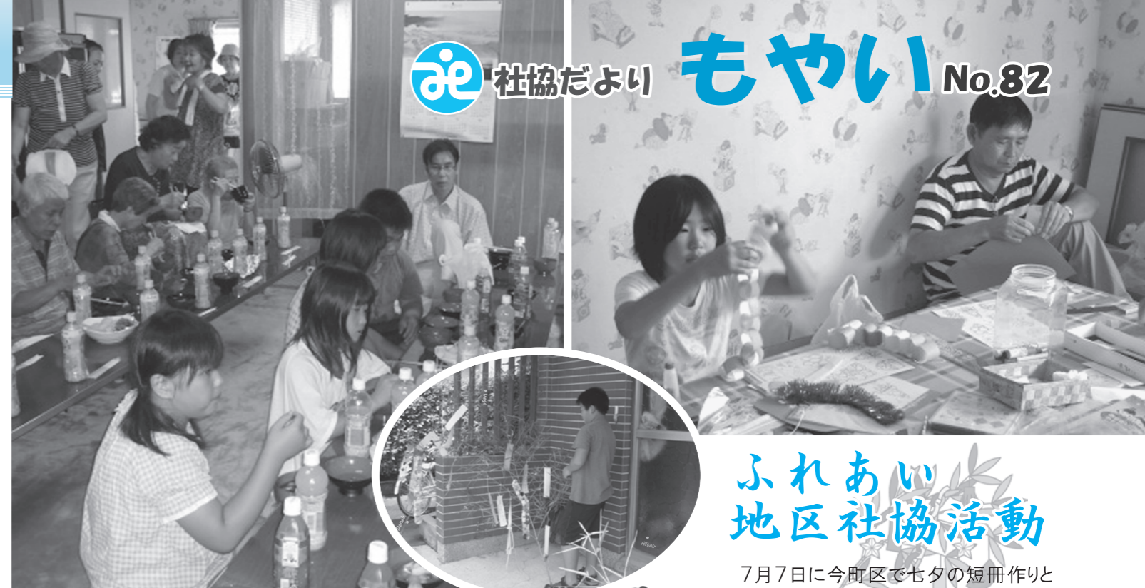
※写真：今町区 ぜんざい会(左)、短冊作り(右・中央)の様子