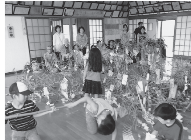
▲赤崎区 七夕の飾り付け

7月7日に今町区で七夕の短冊作りとぜんざい会、赤崎区で七夕の飾り付けが行われました。子どもから大人までそれぞれの願いを綴られました。