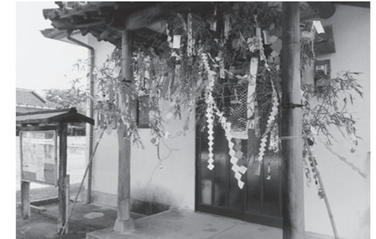
▲赤崎区公民館の玄関