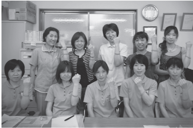
講座を修了した訪問看護ステーションがすのみなさん