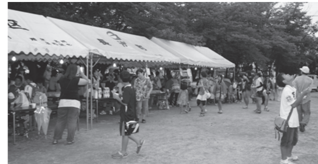
▲子ども会の夜市 焼そば・かき氷・金魚すくい