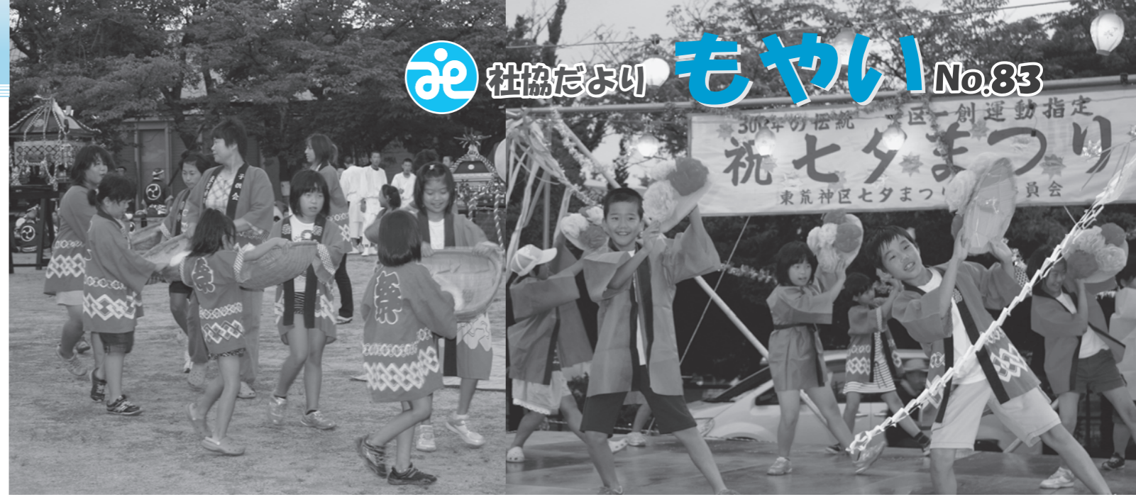
▲七夕の祝い唄 貝殻の入った籠を上下に振る様子