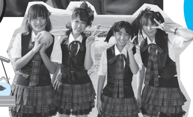
荒尾市ご当地アイドル MJK