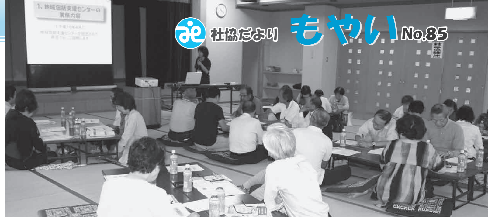
▲六栄校区の様子 地域福祉センター