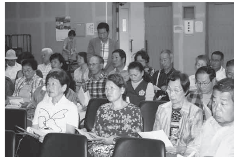
▲長洲校区の様子 町民研修センター

9月24日に六栄校区、9月27日に長洲校区でふれあい地区社協校区别合同研修会が行われました。今回の研修は「地域包括支援センターについて」という題材で行われ、地域包括支援センターが普段どのような業務を行っているか、どのような時に相談できるのか、どのように対応してくれるのかなどの説明がありました。会場からの意見としては「どんなことでもまずは相談してみようと思った。」「各地区や公民館などでもっと周知して欲しい。」などの声があがっていました。