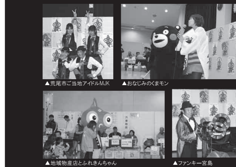
▲荒尾市ご当地アイドルMJK ▲おなじみのくまモン ▲地域物産店とふれきんちゃん ▲ファンキー宮島

社協まつり 11月17日に「笑顔・地域福祉」を取り合って明るく幸せな社会を目指して「」をテーマに地域のみなさんの協力を得て社協まつりを開催しました。 当日は悪天候にも関わらずたくさんの方でにぎわい、点字などの体験コーナーや、地域のみなさんによるいろいろなバザー、ステージでは、長洲町マスコットの「ふれきんちゃん」をはじめ、「くまモン」や町内外の