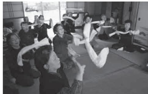
▲タオルを使った健康体操

下本区で11月20日に、いきいきシニア教室が開催され、タオルや棒を使った健康体操が行われました。