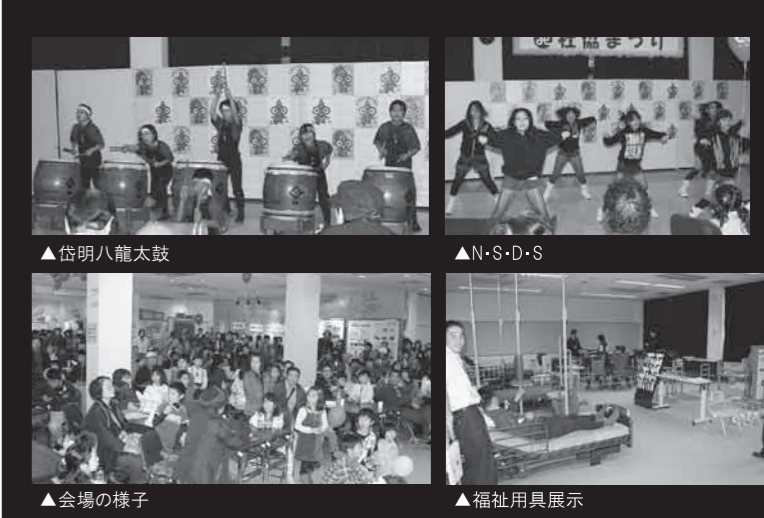
▲岱明八龍太鼓 ▲N・S・D・S ▲会場の様子 ▲福祉用具展示

みなさんによるさまざまなイベントで盛り上がり、会場は最後まで笑顔に包まれていました。 また、福祉用具の展示会場では、普段あまり触れる機会のない器具を前に熱心に説明を受ける姿もありました。 協力をいただいた団体等 九州看護福祉大学、熊本中央信用金庫、太陽シルバーサービズ、長洲中学校、長洲町地域婦人会、長洲町民生員児童委員協議会、ひまわりの里、ベストケア山鹿 (50音順)