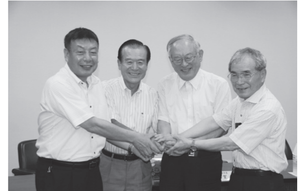
平成24年7月4日に定住自立圏の実現を目指し各市町の意思統一が図られました(写真:左から中逸町長、前畑荒尾市長、古賀大牟田市長、上田南関町長)