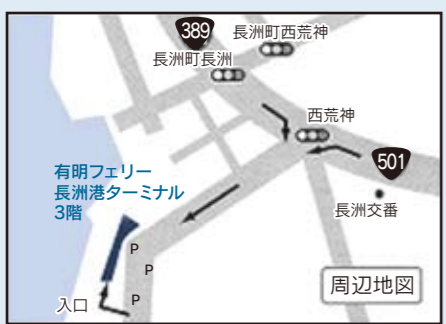
▲荒尾・玉名地域結婚サポートセンターの位置図

結婚サポートセンターが新しいつながりを応援します 荒尾・玉名地域結婚サポートセンターでは、独身の男女の入会者を募集しています。 対象年齢 ：20歳以上(男性に限り荒尾市、玉名市、玉東町、南関町、長洲町、和水町に居住または勤務している人) 登録料 ：無料 内容 ：お見合いのセッティングや各種イベントも定期的に実施しています。 ◎：荒尾・玉名地域結婚サポートセンター(玉名郡長洲町大字長洲2168番地25 有明フェリー長洲港ターミナル3階) ☎0968-17812543