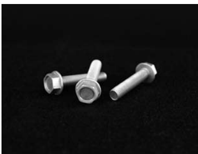
KUMADAIマグネを素材としたネジ