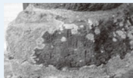
▲法華経の経文と思われる部分

名称で親しまれ、地域の人々に大事に保存されています。下から二番目の四角の石まわりの四面には法華経の経文が彫ってあり、この石からみてこれは宝塔であると思われる。当時、法華経をと見え、後生（生きていく人）の安楽と平和を願ったものとされています。この碑は四王子神社を西に百五十メートルほど行った、六地藏石幢の隣にあります。（みんなの蔵の前）ぜひ一度、見に行かれてみてはどうでしょうか。