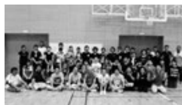
PTA校内ビーチボールバレー大会参加者の皆さん

腹栄中学校の情報はコチラからも! http://jh.higo.ed.jp/fukuei/