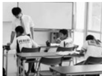
寺子屋勉強会では、保護者や地域住民が丁寧に指導

午前中の2時間程度、保護者・地域住民が指導を行い、生徒たちは夏休みの宿題や受験勉強を頑張りました。学校の教科担当の先生は、個別に生徒を指導し、自主学习を中心とする生徒が寺子屋へ集って勉強。自宅で一人勉強するよりも、集中した集団の中で能率良く勉強することができました。