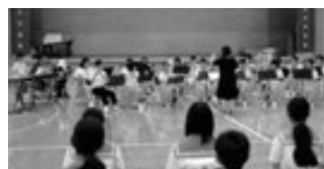
吹奏楽部の歓迎演奏