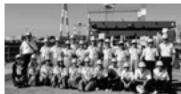
造船所見学の様子