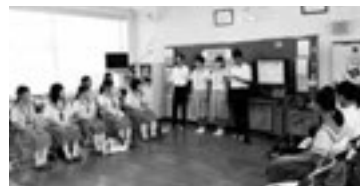
各学校の学校紹介の様子

長洲中学校の情報はコチラからも! http://jh.higo.ed.jp/nagasu/