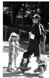
▲六栄保育所での実習の様子

腹栄中学校の情報はコチラからも! http://jh.higo.ed.jp/fukuei/