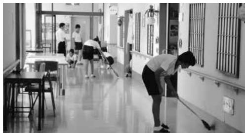
▲月華苑での活動の様子

海岸には海から流れてきたゴミや捨てられたゴミなど、想像していたよりもたくさんのゴミがありました。長洲町の大切な海岸をみんなで協力して、きれいにしていかなければならないと思いました。このAHS活動が長洲町のためになってくれたら嬉しいと思いました。ふだん、海岸を清掃している地域の人たちに感謝し、この活動を今後も続けていきたいと思えます。