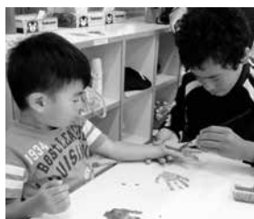
▲長洲こどもの海保育園での実習の様子