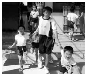
▲ひまわり幼稚園での実習の様子