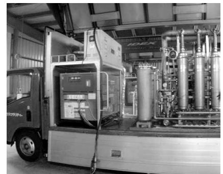
▲MRSろ過装置搭載車両