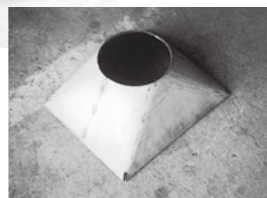
角丸レジューサー