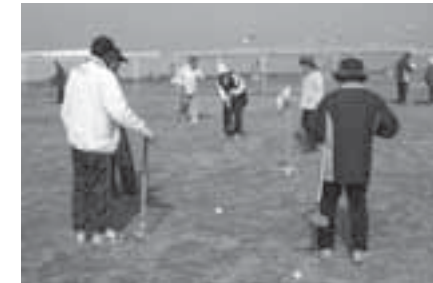
▲親睦を深める参加者たち

第5回有明ソーラーパワーグラウンドゴルフ大会（㈱LIXIL、町主催）が有明ソーラーパワーで開催されました。これは、環境普及啓発の一環として行っているもので、有明ソーラーパワーのPRと、グラウンドゴルフを通じて親睦を深めてほしいと毎年開催しているものです。この日は約300人が参加。いつもと違う芝生の上で行うグラウンドゴルフをはつらつと楽しくプレーする参加者の様子が見られました。