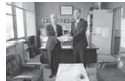
▲「防犯意識の向上を」と平良署長（右）

平良荒尾警察署長は「全国的に声かけ事案などが発生しています。子どもたちにも、自分の身は自分で守れるような意識を持ってほしいです」と話しました。