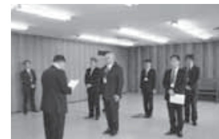
▲辞令を受ける併任職員

これにより各町が相互に税務職員を派遣し、徴収の徴収をすることが可能となり、徴収向上が期待されます。辞令交付式では町長から各町の税務職員に辞令が交付され、任命された税務職員は、これから徴収向上に向けて取り組む決意を示しました。