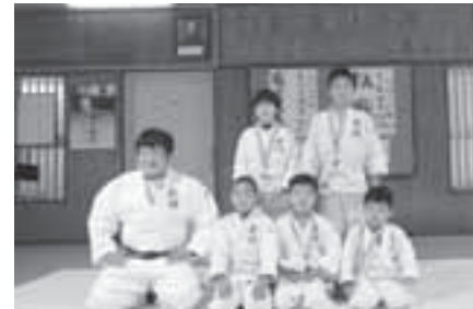
▲入賞した選手たち