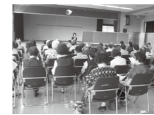
▲ 10/1 長洲町上区 (一人暮らしの集い)