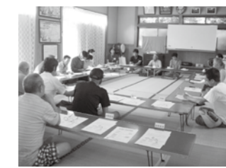
▲ 8/7 立野区