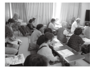
▲ 10/7 出町区