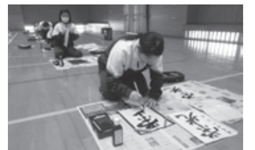
▲書き初めに取り組んでいる様子