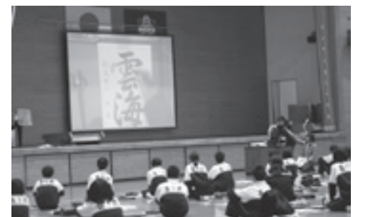
▲説明を聴いている様子

また、ボランティアとして来ていただいた方々に習字のポイントを教えていただきました。書いていると、足に力が入りしびれたり痛くなったりと予想以上に大変でした。でも、今まで机で書いていたときよりも集中して真剣に取り組むことができたのでよかったです。また、書いた作品を互いに見せ合いながら楽しそうに意見交換していました。来年は、専門の講師の先生が来られるので、一生懸命に取り組んで今年以上に満足できる作品にしていきたいと思いません。