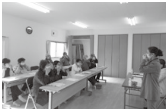
マスクのつけかたを練習する参加者