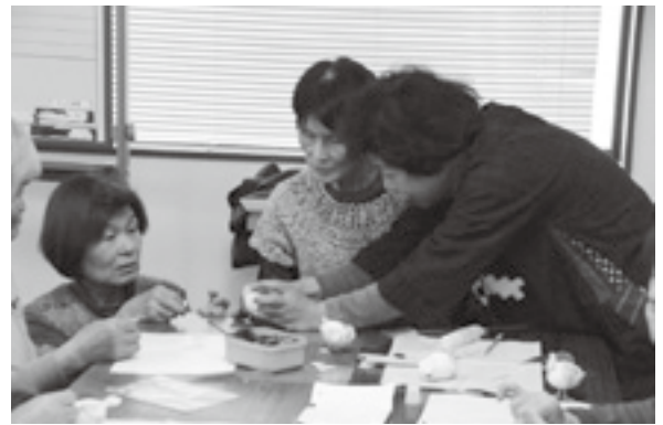
ものづくりを楽しむ区民の皆さん