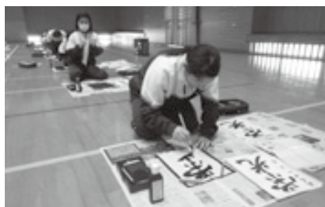
▲書き初めに取り組んでいる様子