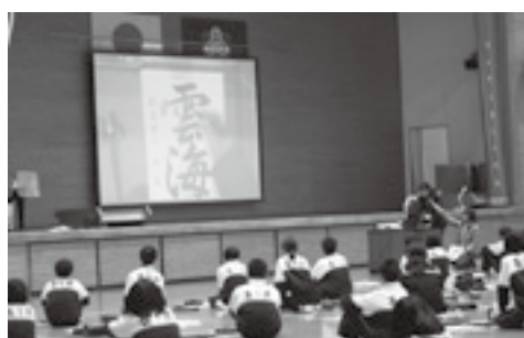
▲説明を聴いている様子

また、ボランティアとして来ていただいた方々に習字のポイントを教えていただきました。書いていると、足に力が入りしびれたり痛くなったりと予想以上に大変でした。でも、今まで机で書いていたときよりも集中して真剣に取り組むことができたのでよかったです。また、書いた作品を互いに見せ合いながら楽しそうに意見交換していました。来年は、専門の講師の先生が来られるので、一生懸命に取り組んで今年以上に満足できる作品にしていきたいと思います。