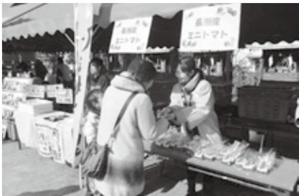
長洲産ミニトマトをPR

両日とも多くの来場者でにぎわい、ミニトマトを受け取った人は、「長洲のミニトマトは甘くておいしい」、「お店で見つけたら買いますね」と笑顔で話し、大好評でした。