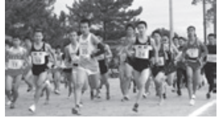
いっせいにスタート、健脚を競う！

また、本大会から新設したフレンドリーシップ部門では、親子で楽しく走る姿が見られました。結果は次のとおりです。