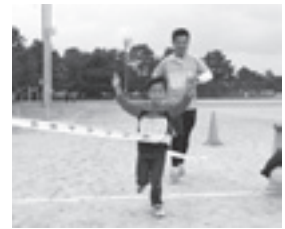
親子そろってゴール！