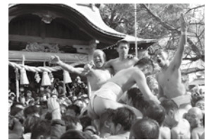
1月15日に四王子神社および有明海で行われ、男衆が威勢よく的を奪い合いました。