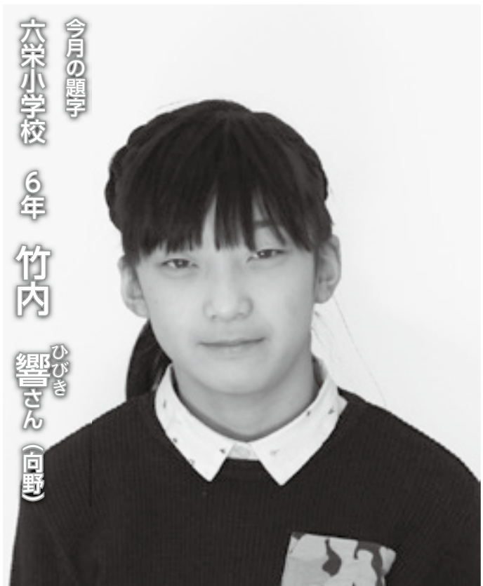
今月の題字 六栄小学校

4月から中学生になるので、今よりもっと集中力をつけることが出来るようにしっかりと先生の話聞いて真剣に授業などを受けたいです。