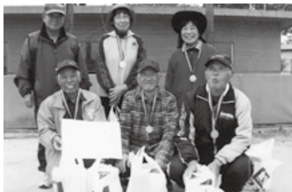
優勝した永方永寿会の皆さん

参加者からは「マスクの使い方を初めて習った」「ラーメンのスープを残すだけで減塩の効果があるんですね」などの声があがり、健康の大切さを学ぶ一日となりました。