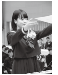
3月14日に腹栄中学校で行われた卒業証書授与式の様子