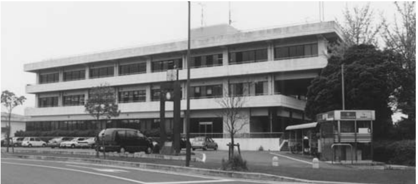
財政改善に取り組む長洲町

A 職員の給料は人事院勧告に準じて平均一・九六%引下げをした。そこで町長、助役、収入役、教育長及び議員については特別職報酬等審議会に報酬改定を諮問した結果、一般職は期末手当と勤勉手当の合計支給率が四・六五ヶ月と〇・〇五ヶ月のマイナスとなっているが、特別職には勤勉手当の支給はない。期末手当が〇・三%のマイナスであり年間報酬にした場合、特別職は二・一五%の減額であり、一般職は年間平均二・二六%の減額となっており、特別職と一般職との間に大きな格差はないとして、今回は改定を見送ることが適当である。」と答申されたので尊重して据置きとした。