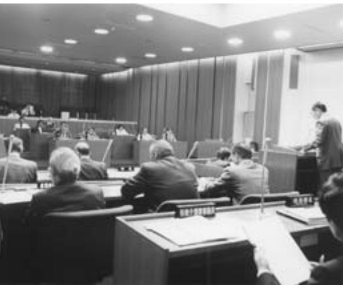
6月の定例会議場風景