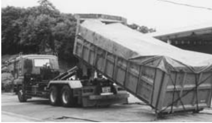
長洲町から菊池市の処分場へ

ミの現況については、処理費五ヶ町で四億五、四八二万八、五〇〇円で、処理費が九、六二六トン、処理費が一トンあたり消費税を加え、四万七、二五〇円で約三倍強の負担増になっている。本町分は三、七〇二トンが見込まれ、一億七、四九一万で五町全体の