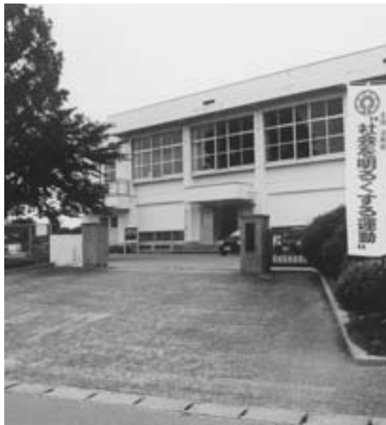
安全対策を万全に

Q 二年前の池田小学 校の悲惨な事件、 今年も相次いで事件や 事故が続いている。プ ールでの事故死、福岡 では通学中の子供にガ ソリンをかけた放火、大 阪ではいまだに子供が 行方不明。