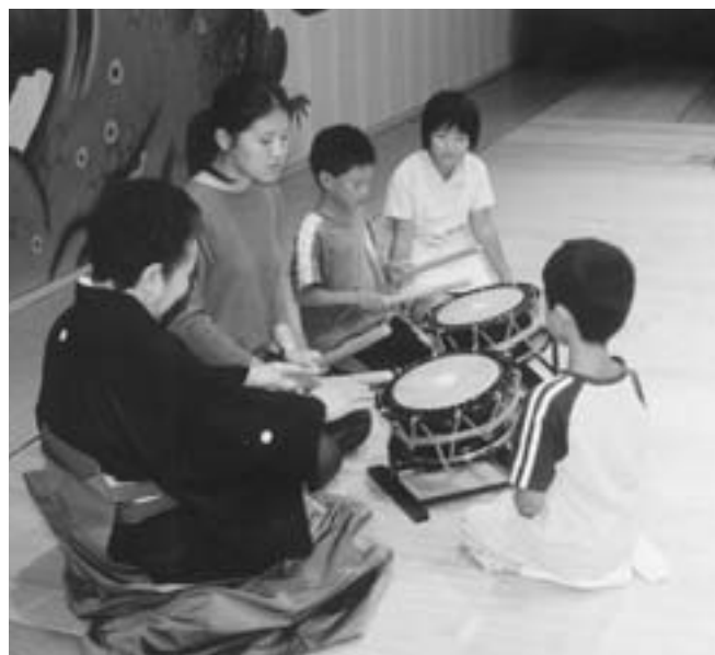
伝統文化を子供たちへ

従って、委員から紹介議員に対し質疑を行い、紹介議員退席後、慎重審議した結果、国は当然義務教育に関する一切の責任義務は、国が負うという基本的な本請願の趣旨からして、この請願について採決を行った。 採決の結果、全員賛成でこの請願は「採決すべきもの」と結論に達した。