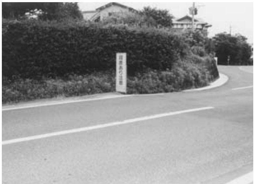
段差に気をつけて

良工事はいつ着工するのか。 A 側溝改良ではなくフラット歩道を設置した、道路改良を考えている。施工延長三六〇メートル、町総合振興実施計画に沿って平成一六年から工事に着工したい。