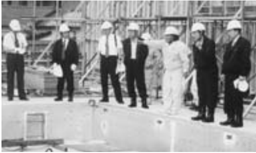
建設中の長洲小プール

本委員会は、所管調査事件の一環「学校教育環境」の長洲小学校プール建設工事の進捗状況の視察を去る六月九日行った。