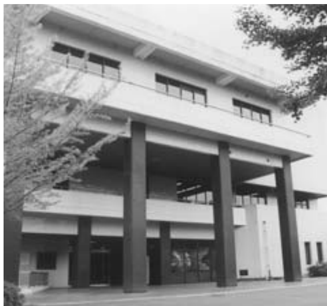
住民の為の合併協議を

Q 財政シミュレーショ ンを作成する場合に、 合併特例債の五七〇億円 を限度いっぱい発行する、 七割発行する、五割発行 する、その三通り、その発 行期間を一〇年均等割、 五年均等割の三通り、そ れと償還方法が三年据え 置きで、償還期間を二〇 年間として、提示してい ただく様、要望しておき ていただきたい。