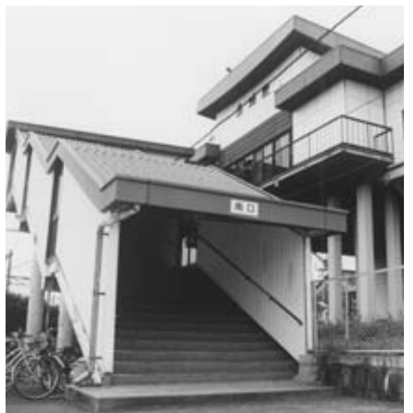
高齢者・障害者にやさしい駅に

Q 高齢化 が進む 中、また障 害を持つ人 達へも優しい 利用しやすい 陸の玄関 口である為 に長洲駅にエ レベーター の設置が欠 かせないと 考えるが。