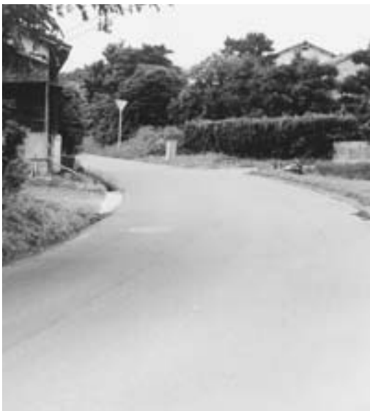
狭い赤崎公民館以西の道路

Q 本町は、地理的に有明海沿い東西に、国道五〇一号线が通っており、統計上一二時間約六、〇〇〇台の車両が通過している。又、有明フェリーやJR長洲駅等不特定多数の利用車（者）がある。このような交通需要と不況脱皮の起爆剤として「道の駅」新設の考えはないか。