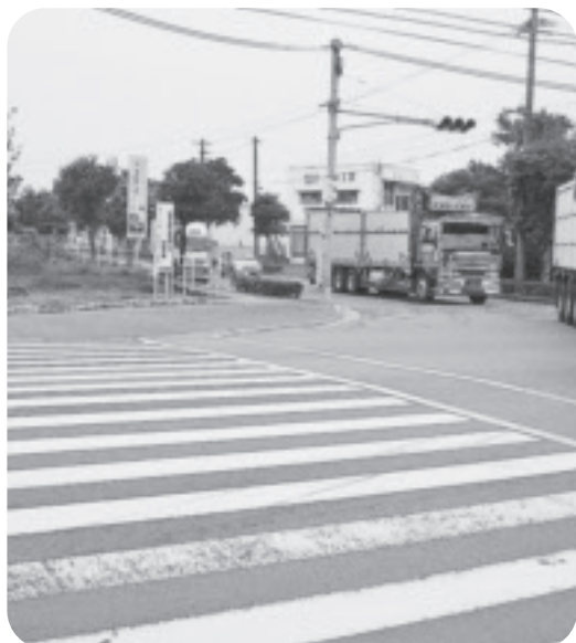
長洲駅・海岸線を左折し長洲・岱明線へ

答 (町長) この2路線は国道501のバイパス道路として大型車の通行が多く一般車も含め、朝夕の通勤時間帯は混雑している。県が長洲海岸に沿って街路事業を進めている。これが完了すれば混雑は解消される。