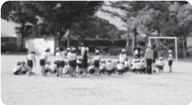
すこやかに育つ子ども達