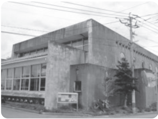
たくさんのスポーツを楽しんだ体育館