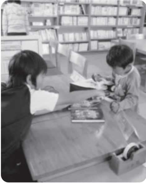
読書推進への施策の充実を

状況だが、本年度も小中学校に30数万円の図書購入費を計上しており蔵書数も図書標準は超えている。また各学校での図書の購入だが、7月に一括注文と誤解を与えているかもしれない。数回に分けて購入することも可能だ。②については、現在は図書司書さんに替わり学校教育推進員さんに