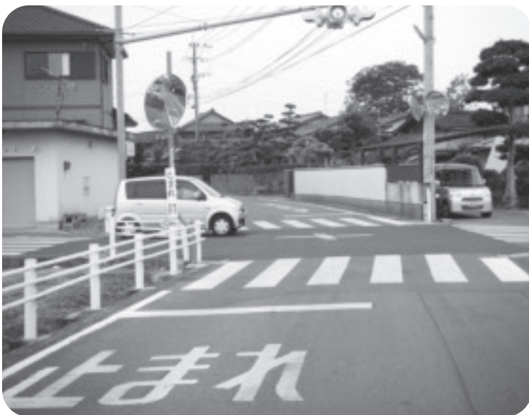
建浜の交差点(中央部分がカラー舗装)