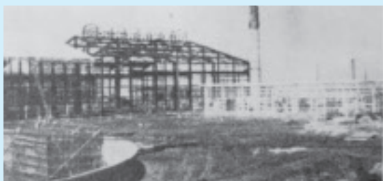
建設が進む不二サッシ

答 水素イオン濃度が5・8未満、CODが平均20ppm以下最大30ppm以下、SSは平均50ppm以下最大70ppm以下、アルミニウム関係が1ppm以下でなければならぬ。暫定的に工場排水は毎日記録するようにしております。