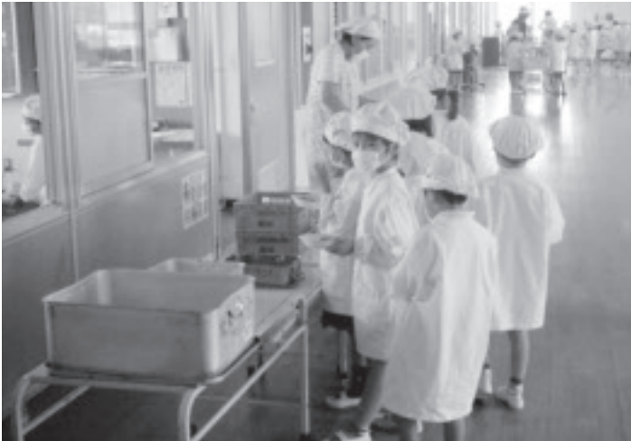
きょうの給食おいしいよ