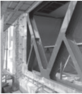
安心・安全な学校づくり

2回目は腹赤小学校体育館の耐震補強工事の視察とその後学校給食の試食を行った。体育館の天井に28基のプレスが補強され、現在は防水塗装工事中との説明を受けた。 次に荒尾市に委託している給食のようす等を視察した。