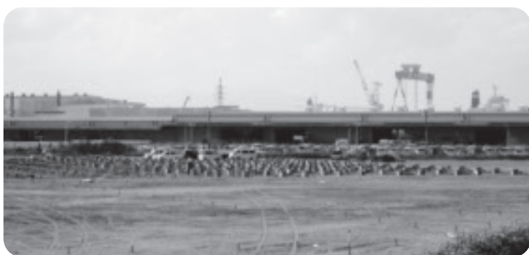
期待は雇用の増大