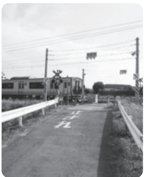
何十年も変わらぬ踏切