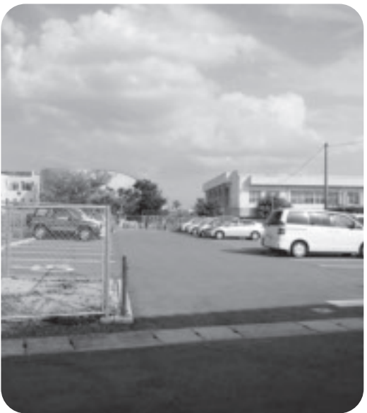
給食センター跡地。今は、駐車場に