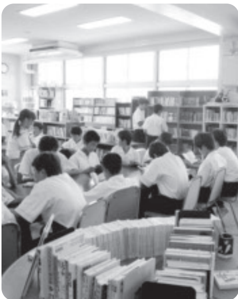
暑さ対策で学力向上を

答 (教育長) 来年度緑のカーテン等対策の一つとして進める。来年以降も猛暑が予想されるが、教室内に扇風機等必要だと思いが。