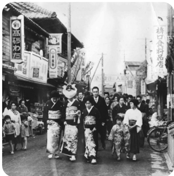
本町通り商店街(昭和30年代ごろ)

答 (まちづくり課長) 中小商業活力事業や地域商業再生事業などが公募されている。事業の主体がNPO法人や地域の商店街組織などを対象としているが、町としては商工会に呼びかけはしている。しかし地域の事業者の理解、やる気、商工会との