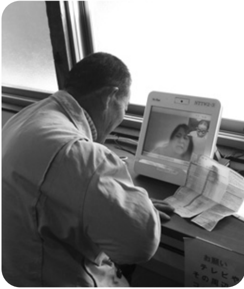
テレビ電話で健康チェック

答 介護予防拠点をいかに活用するかが大きな課題である。光ファイバーによるソフト事業をさらに進めて介護予防に取り組み、住みよい町づくりを展開したい。