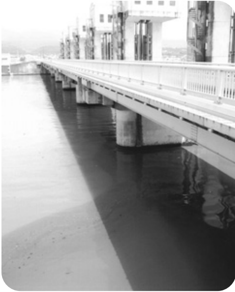
諫早湾潮受け堤防排水門