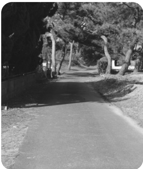
待たれる道路整備

問 今回の道路対策に合わせ、この際悪路である火葬場道路を整備してはどうか。人の最後を迎えられた方々を乗せた車が、ガタガタ路を行かれるのは、お亡くなりになられた方々に対する尊敬の念がない。この際整備したらどうか。