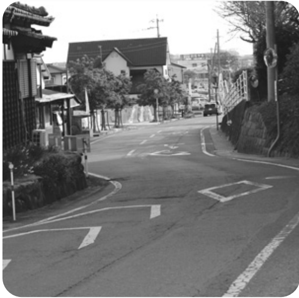
腹赤小東側道路(北側より)

問 用地確保には約半世紀前に地権者との話し合いを町がしている。話し合いの中で地権者が代替地を要求