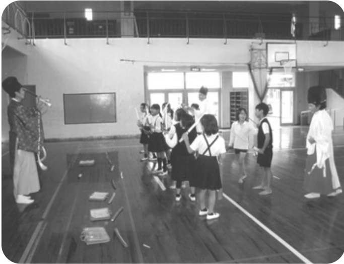
神楽の体験をする子ども達

答 (教育長) 先人から受け継いだ文化遺産を今後も地元の方々と協力しながら伝えていく。