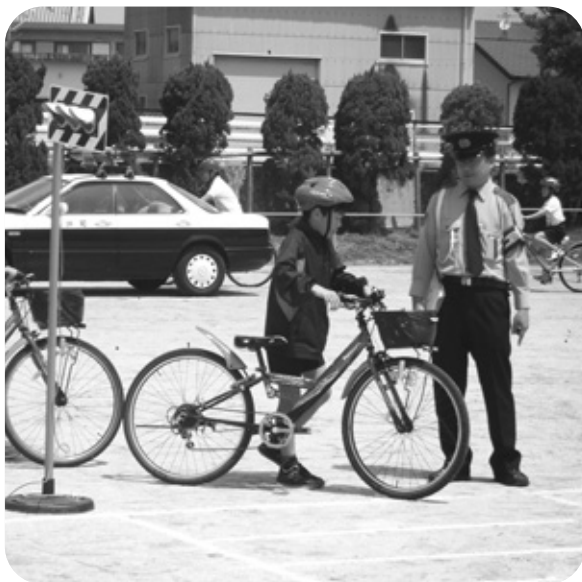
マナーやルールを守ろうね!

死亡事故の半数が高齢者であり、事故防止に向け、歩行者の反射材着用の普及・啓発に力を入れていきたい。 問 (教育長) 今年度、町内の児童・生徒が自転車の接触事故を起こすという事案が発生した。この事故を受け保護者を開催し、再度、交通事故防止について指導を行い、また損害賠償保険等への加入についても説明した。今後も安全教育の徹底を図るとともに、自転車の安全利用の指導や啓発、マナー向上、正しいルールの実践を呼びかけ、『反射たすき』がけの義務化や自転車事故被害者・加害者救済のための保険制度の周知を進めていきたい。また通学路の危険箇所について