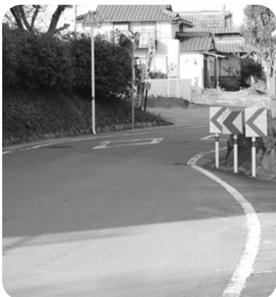
腹赤小東側道路(南側より)

問 用地確保には約半世紀前に地権者との話し合いを町がしている。話し合いの中で地権者が代替地を要求