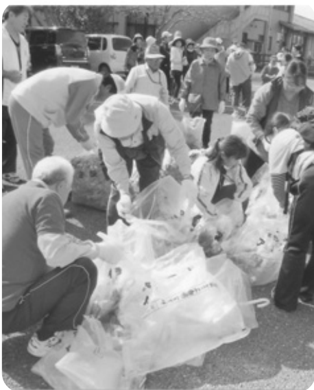
ボランティア活動する民生児童委員

答 (町長) 訪問する際のガソリン代や電話代なども重要だと理解している。管内市町等の状況も参考にし、検討していく。