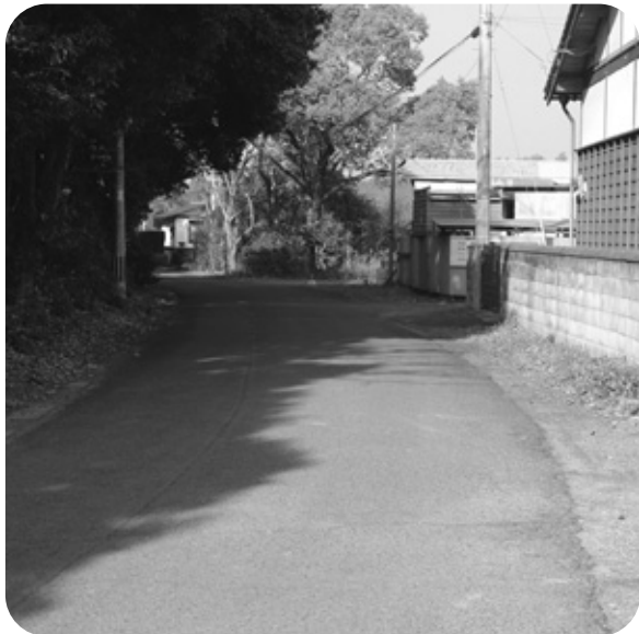
未給水世帯の解消を

答 (建設課長) 圃場整備の区画360mのところと思う。平成13年に測量設計が終わっており、今後、道路改良を進めるに当たっては、地元の協力を得て用地を取得しなければならぬが、接続道路である向野・平原線の進捗に合わせて検討する。