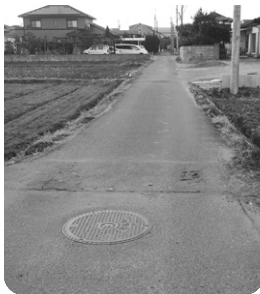
緊急車両の入らない狭い道路

権者方の協力が100%得られることが大切と考えている。 答 (建設課長) 区長さんを代表とする地域の方から話を聞き、さまざまな問題点や条件を解決できるかどうか判断していきたい。