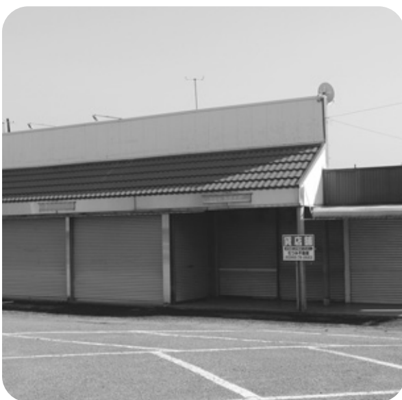
待たれる店舗開設

住宅が立地し、住環境に恵まれた地域である。町は道路整備並びに上下水道整備を進めている。今後六栄校区発展のため地域内の道路整備を