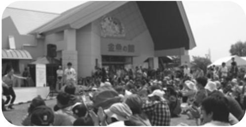
イベントにも活用されている