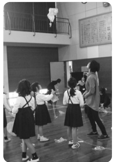
子育て支援に欠かせない学童保育