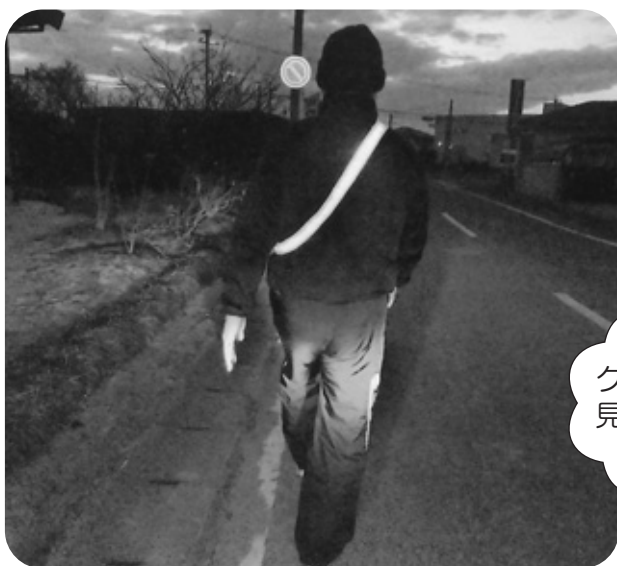
「反射たすき」の着用を

も、学校、PTAの点検結果をもとに児童生徒の事故防止に努めていきたい。 問 これまで『反射たすき』を配布されてきたが、今後いかに着用してもらうかの取り組みに力を入れてほしい。夜間でも反射して見える看板でドライバーに注意を促す。また、町内に300本以上立っているカーブミラーのポールの部分に自転車や歩行者に注意を促す看板を設置する等の考えは。 答 (町長) 今、指摘があった点を含め、事故防止に向け取り組んでいきたい。(学校教育課長) 12月1日から改正道路交通法が施行され、特に自転車は、罰則も厳しくなっており、それに