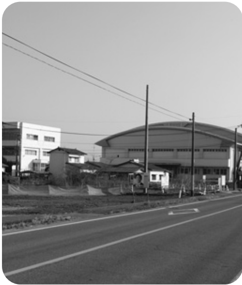
教育環境に配慮を

問 新山・海岸線については、騒音対策、交通安全対策その他、教育委員会では何か協議されたか。