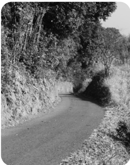
生活環境の改善を

答 (建設課長) 圃場整備の区画360mのところと思う。平成13年に測量設計が終わっており、今後、道路改良を進めるに当たっては、地元の協力を得て用地を取得しなければならぬが、接続道路である向野・平原線の進捗に合わせて検討する。