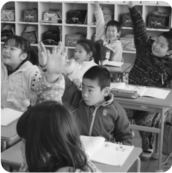
すくすく育て ながすっ子

中心に進めていきたい。ある。また「住民ニーズと公共サービスの整合性を図ること」といった意見もあり利用者をはじめ関係機関の方々と協議が必要である。