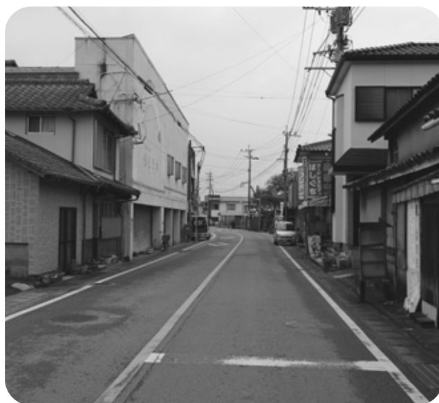
本町通り商店街(現在)

答 (町長) 商工業者の方々にも少しでも活気が出る施策の展開を行政も一緒になってやっていかねばと思っている。提案を聞きながら努力していく。