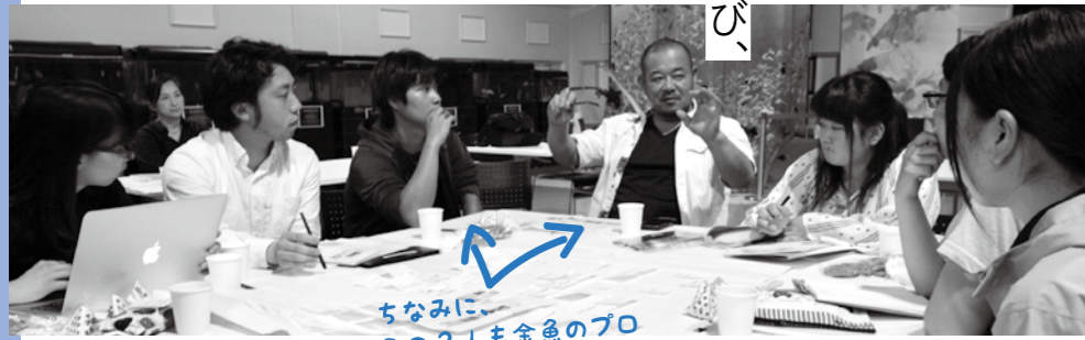
ちなみに、 この2人も金魚のプロ

館内に 金魚のプロを呼び、 お客さんに 金魚のことを 色々説明して もらいたい!