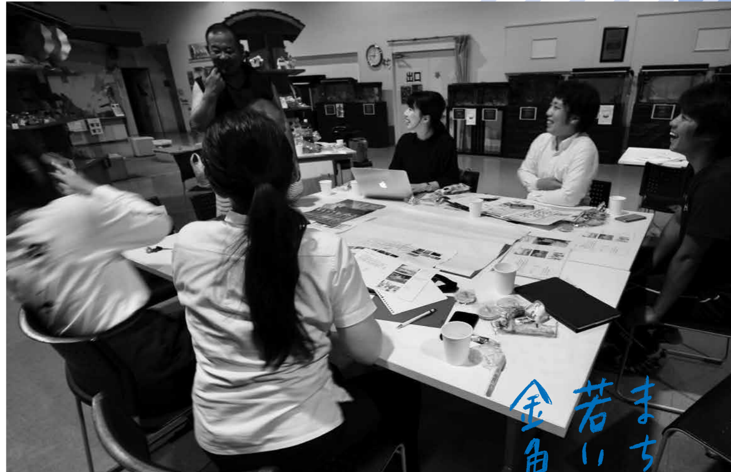
金魚のまちあそびメンバーと、応援に駆けつけてくれた うちちゃん(金魚小売店店主)

長洲町に古くから伝わる嫁入り唄に出てくる囃し言葉。見知らぬ土地へと旅立つ花嫁に「荒波を越えて行け」と励ます想いが込められたこの地域特有の言葉です。平成30年3月に、まちの面白そうなヒト・モノ・コトをいろんな人に伝えたい、応援したい！そんな想いを込めた冊子に「のんしこら」という名前を付け発刊しました。今号から、「広報ながす」にも不定期で登場することになりました。まちの面白そうなヒト・モノ・コトのいまをお伝えします。詳しくはwww.nonshikora.comまで。