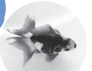
昨年の長洲町長賞