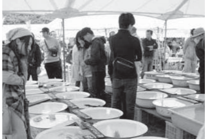
例年、審査の後の一般展示(午後1時から)は、多くの人で賑わいます