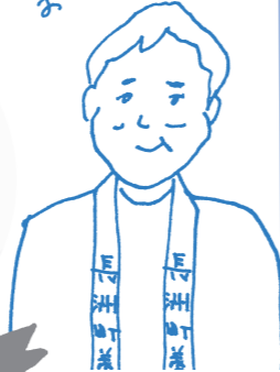
昨年の長洲町養魚組合長賞

もちろん! 自慢の金魚がいればぜひ出品してみよう。当日参加でも大丈夫! 当日朝から金魚を連れてきてもらえるといいですよ。 多くの人に、愛情持って育てている金魚を出品してほしいな。買った金魚でも良いんですよ。自分の金魚の評価を試してみるのにも良い機会になると思います。今年賞に入らなくても来年賞がとれるかもしれないし。多くの人にチャレンジしてほしいです。