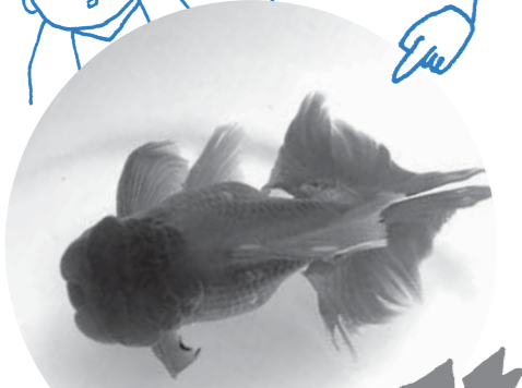
昨年の熊本県知事賞