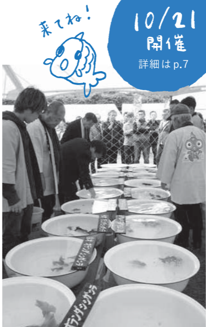
昨年の長洲町金魚品評会審査会の様子 (審査中は関係者以外立ち入り禁止です)

長洲町に古くから伝わる嫁入り唄に出てくる囃し言葉。見知らぬ土地へと旅立つ花嫁に「荒波を越えて行け」と励ます想いが込められたこの地域特有の言葉です。平成30年3月に、まちの面白そうなヒト・モノ・コトをいろんな人に伝えたい、応援したい! そんな想いを込めた冊子に「のんしこら」という名前を付け発刊しました。「広報ながす」にも不定期で登場することになりました。まちの面白そうなヒト・モノ・コトのいまをお伝えします。詳しくは、www.nonshikora.com まで。