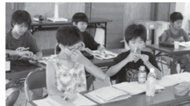
それぞれ宿題に取り組む子どもたち