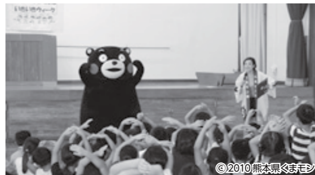
くまモンと〇×クイズに挑戦