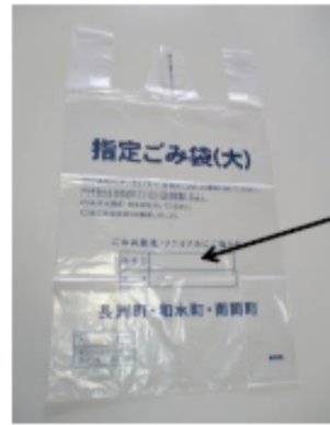
Designated garbage bag (L)

Upper: Room number Bottom: Name Please write and throw it away.