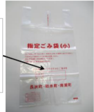
Designated garbage bag (S)

Upper: Room number Bottom: Name Please write and throw it away.