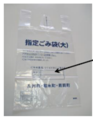
Designated garbage bag (L)