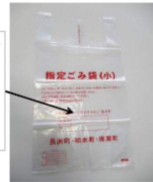
Designated garbage bag(S)

Upper: Room number Bottom: Name Please write and throw it away.