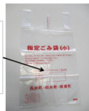
Designated garbage bag (S)

Upper: Room number Bottom: Name Please write and throw it away.