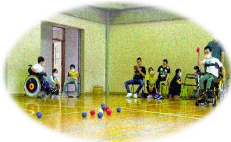
ユニバーサルスポーツ「ボッチャ」を楽しむ