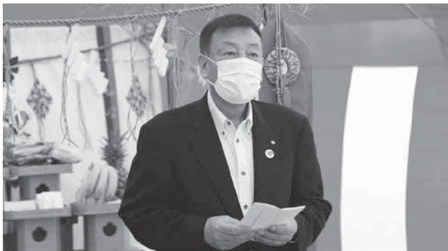
挨拶をする中逸町長