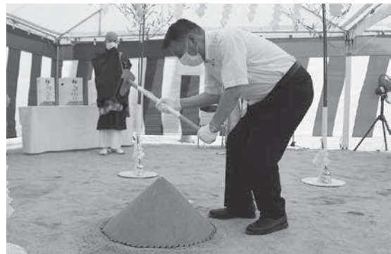
鎮入れを行う中逸町長