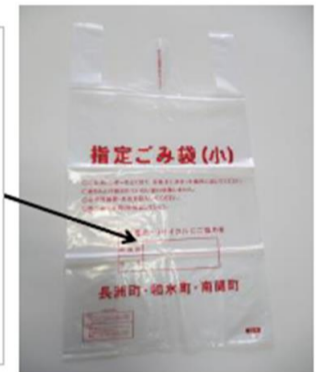
Itinalagang basurang bag(S)

Itaas na bahagi : Numero ng kuwarto Ilalim na bahagi : Pangalan Tiyaking isulat at itapon.