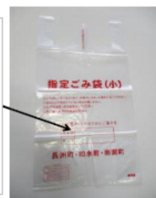
Itinalagang basurang bag(S)

Itaas na bahagi : Numero ng kuwarto Ilalim na bahagi : Pangalan Tiyaking isulat at itapon.