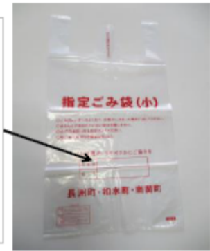
Itinalagang basurang bag(S)

Itaas na bahagi : Numero ng kuwarto Ilalim na bahagi : Pangalan Tiyaking isulat at itapon.