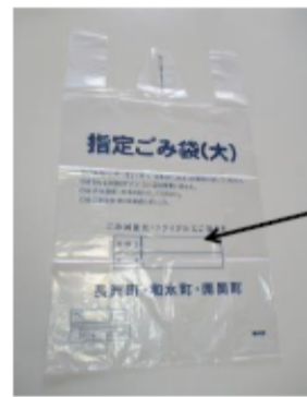
Itinalagang basurang bag(L)

Itaas na bahagi : Numero ng kuwarto Ilalim na bahagi : Pangalan Tiyaking isulat at itapon.