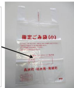
Itinalagang basurang bag(S)

Itaas na bahagi : Numero ng kuwartero Ilalim na bahagi : Pangalan Tiyaking isulat at itapon.