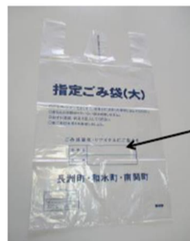
Itinalagang basurang bag(L)

Itaas na bahagi : Numero ng kuwarto Ilalim na bahagi : Pangalan Tiyaking isulat at itapon.