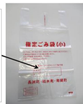
Itinalagang basurang bag(S)

Itaas na bahagi : Numero ng kuwarto Ilalim na bahagi : Pangalan Tiyaking isulat at itapon.