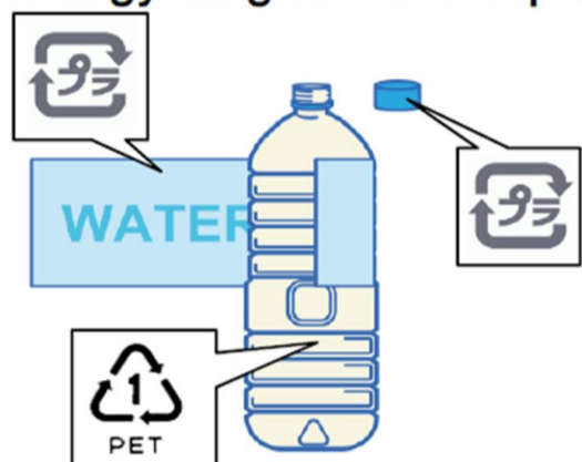
Pamamaraan ng pag-uuri ng plastic bote.