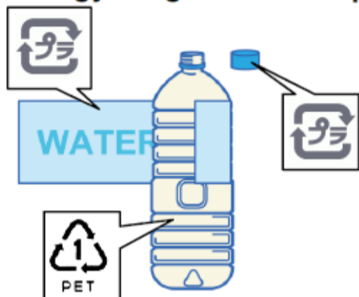
Pamamaraan ng pag-uuri ng plastic bote.