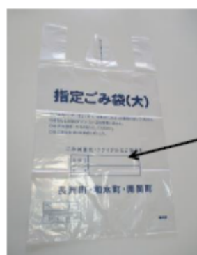
Itinalagang basurang bag(L)

Itaas na bahagi : Numero ng kuwarto Ilalim na bahagi : Pangalan Tiyaking isulat at itapon.