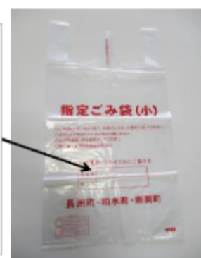
Itinalagang basurang bag(S)

Itaas na bahagi : Numero ng kuwarto Ilalim na bahagi : Pangalan Tiyaking isulat at itapon.