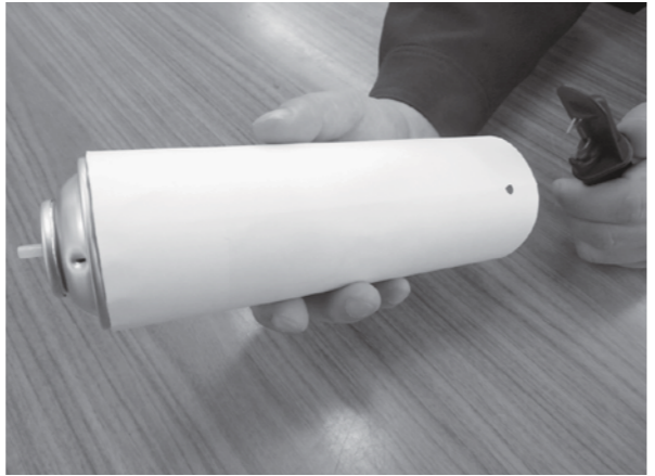
📞 住民環境課 環境対策推進係 ☎78-3122