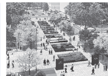
ニコライ・バーグマン氏の監修による大花壇イメージ（花畑広場）