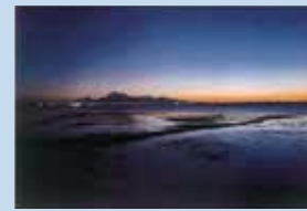
渡邊 沙央里 「Life is beautiful」