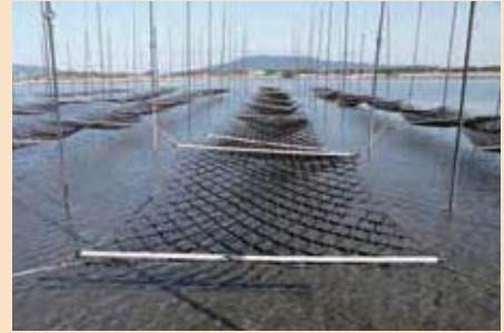
甲木 喜一郎 「豊かな森が 豊かな海をつくる」