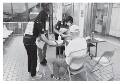
駅でのマイナンバーカード受付の様子