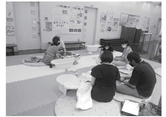
沐浴練習をする参加者