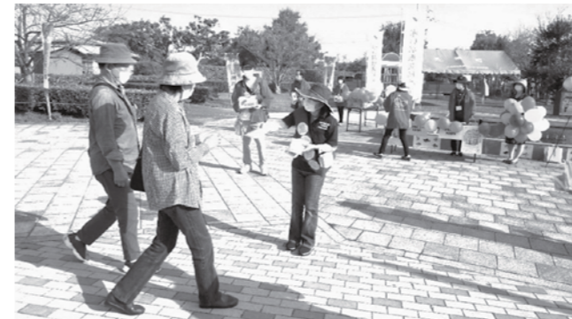
チラシを受け取る来場者

これは、SDGsの視点から、使わなくなった衣類や小物などを提供していただき配布するもので、開催中は、たくさんの人が来場しました。来場した人からは、「お気に入りの服をたくさん選べたので良かったです」、「すごく助かります。また開催してほしいです」といった感想が聞かれました。