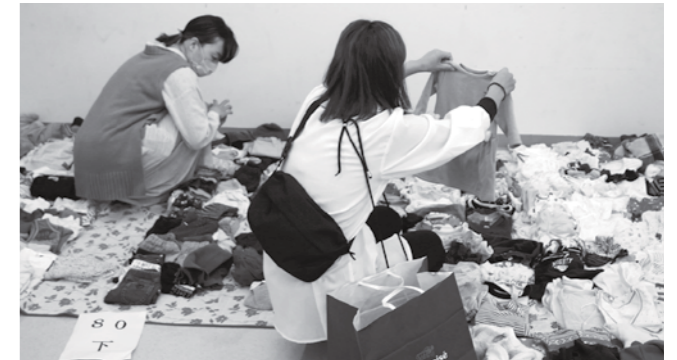
衣類を選ぶ来場者