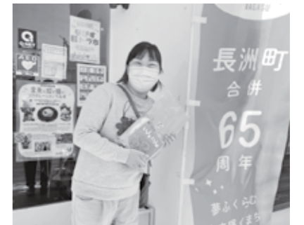
▲お土産を持って訪問に伺います！