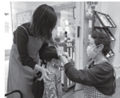
▲乳幼児健診での活動の様子①