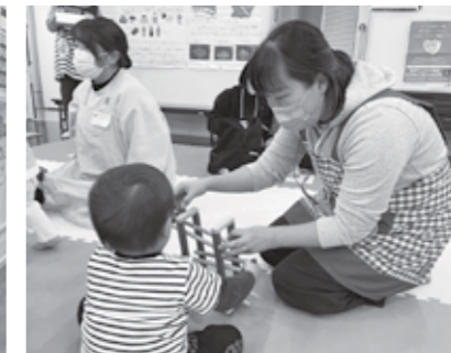
▲乳幼児健診での活動の様子②