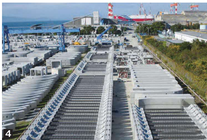
1 工場外観 2 地域未来牽引企業にも選定されました 3 トローリーから流し込まれた生コンクリートを、型枠に流し込んでいきます。 4 出荷を待つコンクリート製品