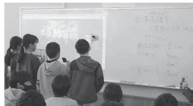
カメラとマイクでお互いの映像、音声共有しながら交流が行われました

寄贈を行った園田理事長は、「事故に遭わないよう、子どもたちが明るく元気で過ごすことを願っています。小学新1年生の交通安全教育に役立てていただければ、ありがたいです。」と話されました。