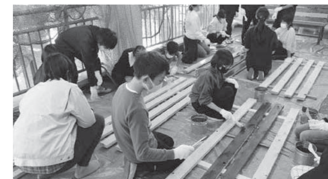
刷毛で塗料を塗っていく生徒たち

授業の中では、それぞれの地域の「食」「気候」「生活環境」「文化」などを、児童自らがすべて英語で発表し、互いにクイズを出し合うなど、海を越えた貴重な交流となりました。