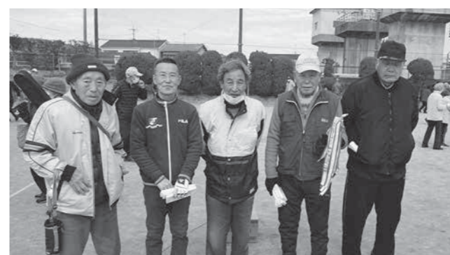
優勝した新山Aチームの皆さん