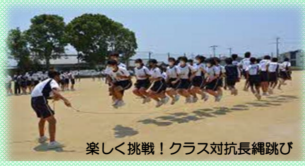
楽しく挑戦！クラス対抗長縄跳び