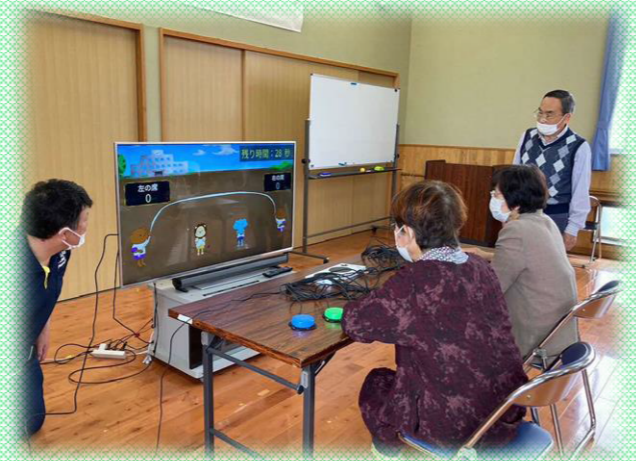
誰もが一緒に楽しめるUde スポーツ体験会