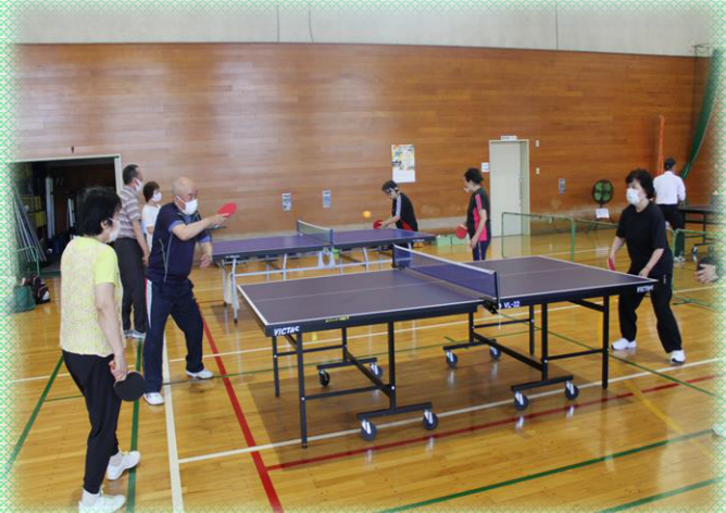
「ラージボール卓球」で身体をリフレッシュ