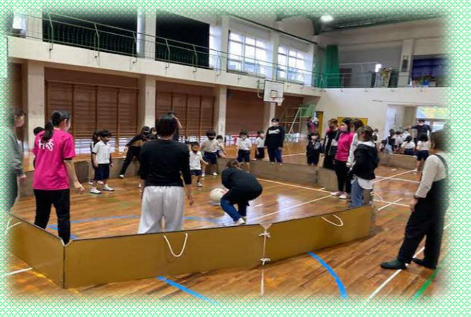
新感覚ドッチボール「ガガ」の様子