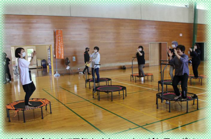
リズムに合わせて元気よくウォーキングトランポリン