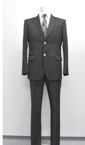
▲スラックスタイプ