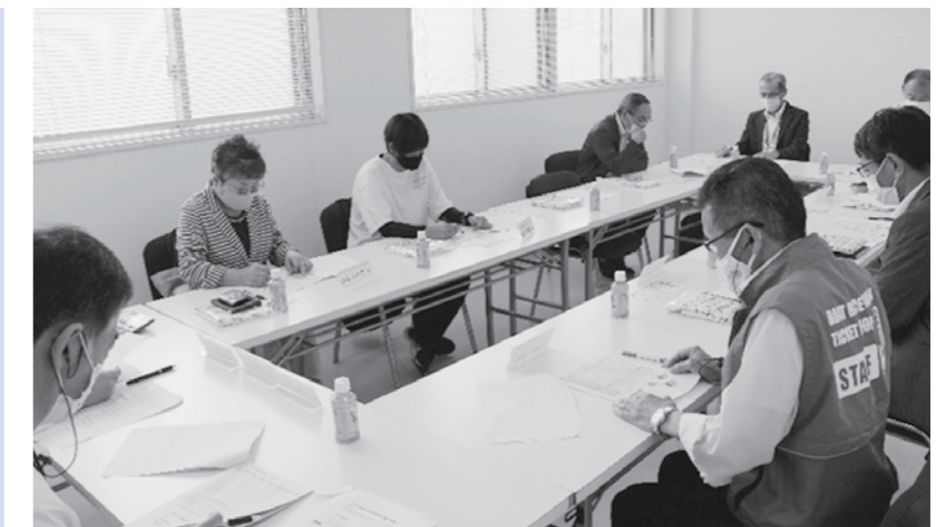
令和5年度ボートレースチケットショップ長洲運営協議会の様子

ボートレースチケットショップ長洲運営協議会を原則年に1回開催し、チケットショップおよび周辺環境や環境整備協力費について適正な運営・執行がなされているか、地域の代表者等による審議が行われています。