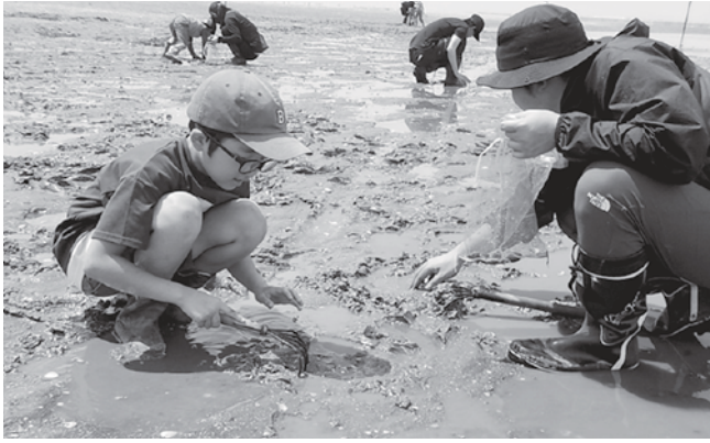
干潟体験を楽しむ親子