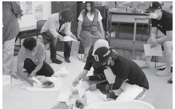
お風呂入れの体験をする参加者