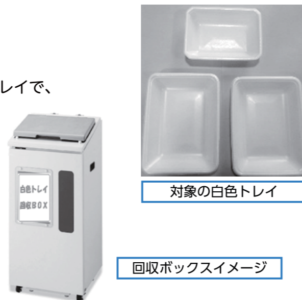
対象の白色トレイ